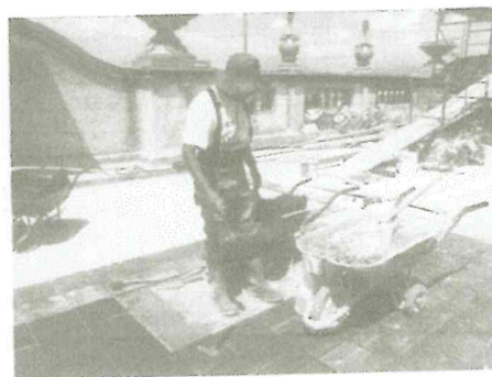
Trazo e inicio de colocación de baldosa de barro en Torreón Central